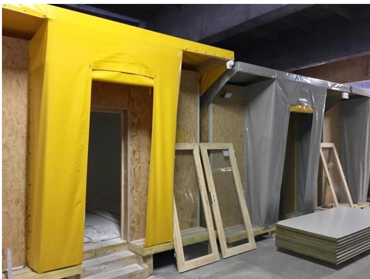
Illustration 3: Modules livrés pour corps d'état technique