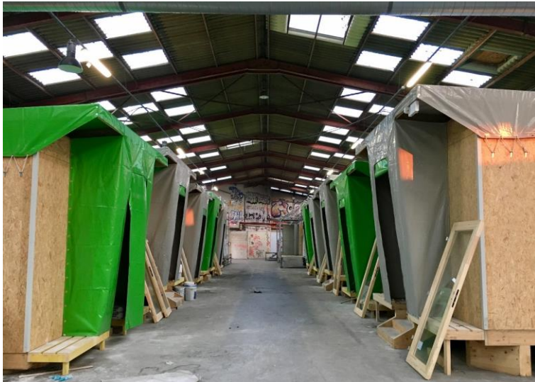
Illustration 2: Allée de 10 Modules